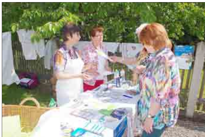
Am Wäschestand der Landfrauen