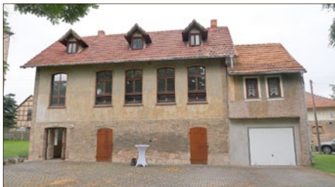
Das sanierungsbedürftige Bürgerhaus in Ellicheben