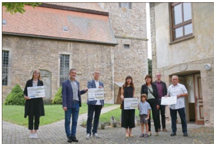
Freude bei den Projektträgern über die Förderschecks